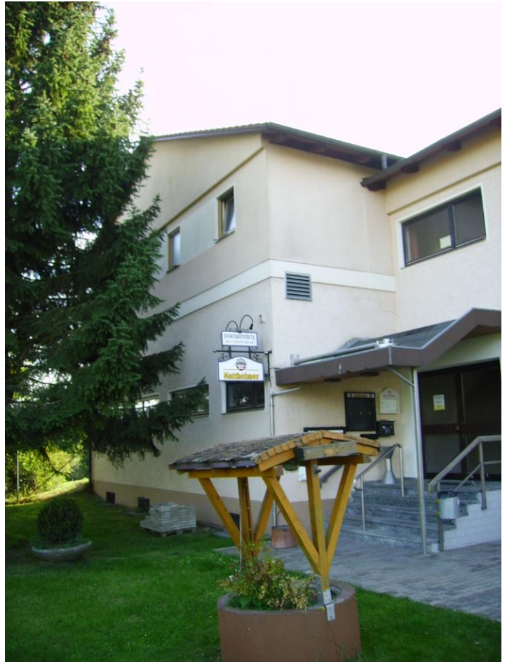
Bild: Vereinsheim Außenansicht