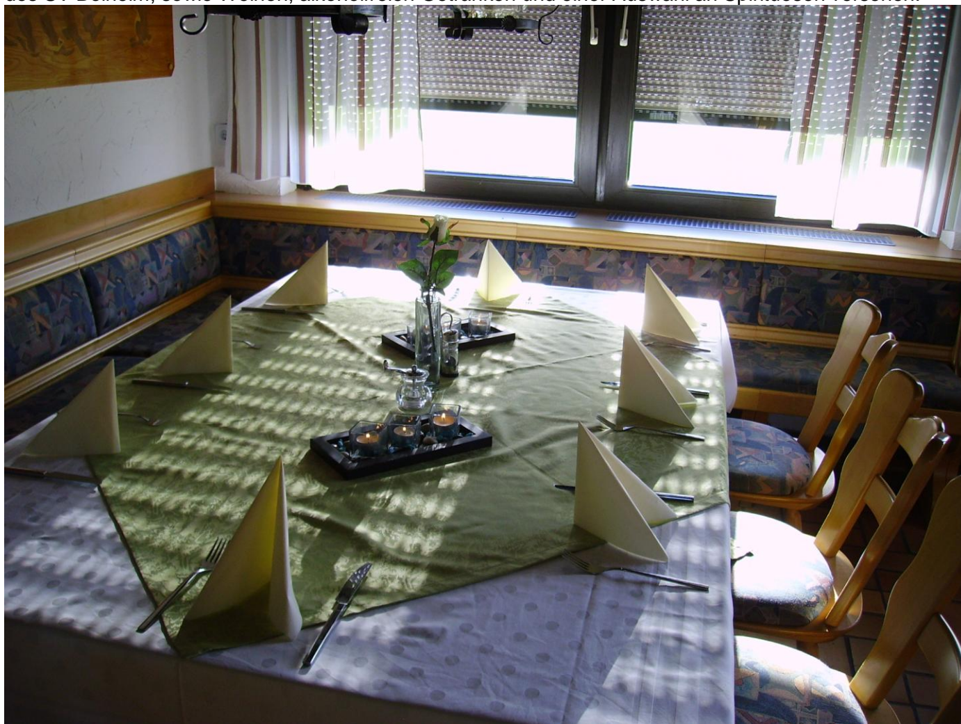
Bild: Gedeckter Tisch in der Gaststätte

anderem eine Gemüseplatte angeboten und die Salatkarte mit fünf verschiedenen Salatplatten lassen keine Wünsche offen. Auch spezielle Angebote sind auf der Karte zu finden, so werden Aktionstage mit verschiedenen Speisen angeboten. Montags ist „Nudelday“, dabei gibt es drei verschiedene Nudelgerichte zusätzlich, am Mittwoch ist „XXL Abend“, hier ist eben einiges etwas größer als sonst im Angebot zu finden und schließlich am Sonntag das Weißwurst Frühstück ab 09.00 Uhr. Zudem sind auf einer Tageskarte ständig aktuelle und traditionelle Gerichte zu finden. Insgesamt findet man eine gut sortierte deutsche Küche zu moderaten Preisen. Das Getränkeangebot ist wieder mit den guten Nattheimer Bierspezialitäten, dem Partner des SV Bolheim, sowie Weinen, alkoholfreien Getränken und einer Auswahl an Spirituosen versehen.