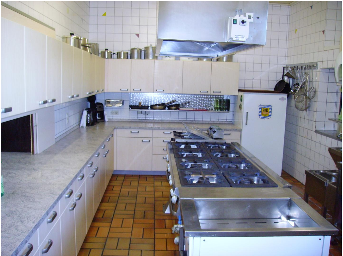
Bild: renovierte Küche

Um Ihnen die Entscheidung, in unserer Vereinsgaststätte einzukehren zu erleichtern, hier eine Auswahl aus der aktuellen Speisekarte: